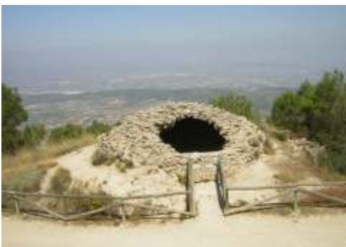
Cava de l'Habitacio, Agres

Altitud: 1.290 m. / Capacidad: 2.200 m3. Diámetro: 13 m. / Altura: 16,60 m.