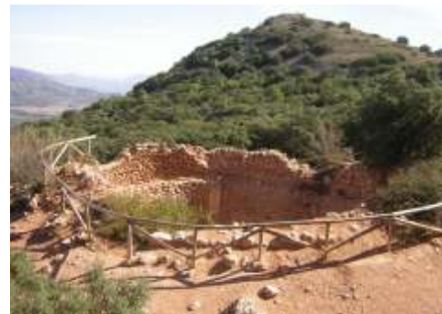
Cava de Coloma, Alcoy

Altitud: 1.050 m. / Capacidad: 1.700 m3. Diámetro: 14,50 m. / Altura: 10,20 m.