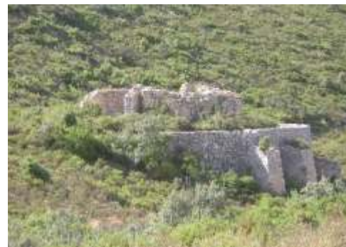
Cavas de Carcaixent (de abajo), Belgida

Altitud: 1.000 m. / Capacidad: 600 m3. Diámetro: 9,70 m. / Altura: 8,10 m.