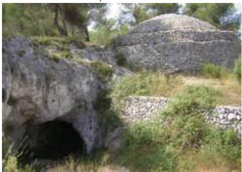
Nevera de Baix, Alcalá de la Jovada

Altitud: 1.110 m. / Capacidad: 1.100 m3. Diámetro: 11,40 m. / Altura: 11,20 m.