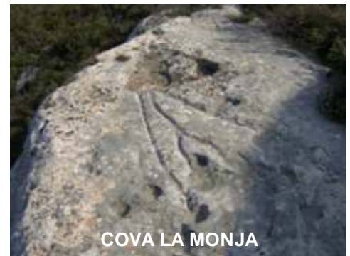
COVA LA MONJA

En algunos rincones apartados de nuestras sierras, también se encuentran curiosos petroglifos, desde las clásicas cazoletas del Barranc de Mastec (Cocentaina) o Capaimona (Tollos), pasando por las cruces del Campo de Mirra, los curiosos dibujos de Facheca, y la Cova de la Monja (Bocairent), y el espectacular grabado de la Peña el Dimoni (Milleneta). Toda una serie de representaciones grabadas en la roca, realizados en algún tiempo y con algún propósito o cometido. El significado de estos signos sigue siendo tema de debate entre los investigadores.