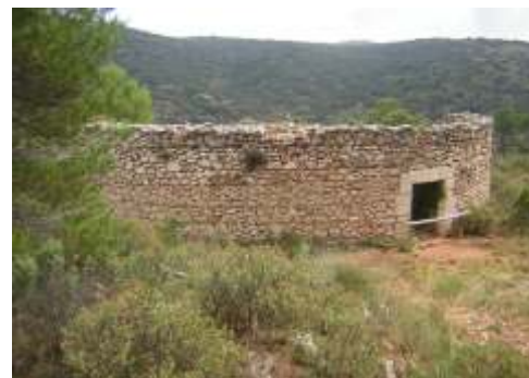
Cava de Simarro, Ibi

Altitud: 1.000 m. / Capacidad: 640 m3. Diámetro: 10,20 m. / Altura: 7,90 m.