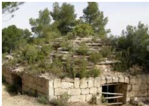
Pou del Carrascar, Castalla

Altitud: 635 m. / Capacidad: 700 m3. Diámetro: 9,50 m. / Altura: 10 m.