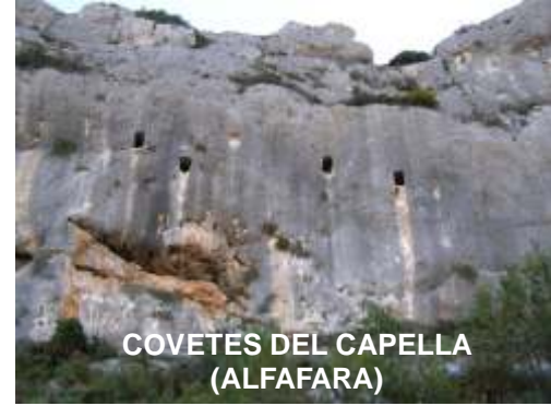
COVETES DEL CAPELLA (ALFAFARA)

Las Cuevas-finestra suelen tener una entrada rectangular, como ventanas de dintel recto y contorno algo irregular, por lo que en algunas ocasiones se las llama "Finestres". Se encuentran siempre en escarpaduras sin orientación definida, en parajes áridos y agrestes. Se pueden observar agrupadas en una misma área a distintos niveles, pueden estar comunicadas o aisladas. Su acceso suele ser difícil, teniéndose que aplicar técnicas de escalada para llegar a estas ventanas. Son de planta rectangular, con anchuras y profundidades diversas, con la pared opuesta a la entrada semicircular, pero más corrientemente recta, con los ángulos redondeados; el techo es casi plano, como bóvedas rebajadas. Algunas opiniones creen que estas cavidades se utilizaban como graneros o pequeños almacenes. De los grupos o conjuntos de las cuevas-finestra, que existen la Comunidad Valenciana, uno de los más importantes es el de "Les Covetes dels Moros" de Bocairent, este conjunto de 59 ventanas se descubren en una pared completamente vertical. Todas las bocas poseen unas características similares, de forma rectangular, cincuenta de ellas están intercomunicadas, siendo nueve de ellas falsas bocas.