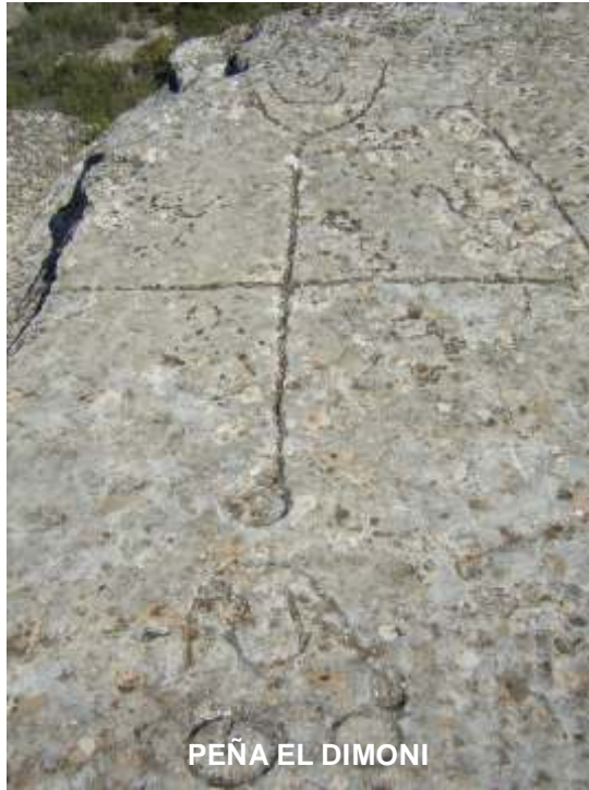
PEÑA EL DIMONI