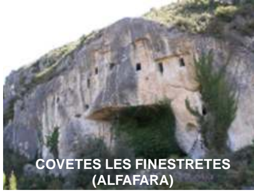
COVETES LES FINESTRETES (ALFAFARA)

El hombre primitivo ocupó cuevas y abrigos, buscando un refugio donde cobijarse de la noche y de las inclemencias meteorológicas. Con su constante evolución, empezó a construir casas, de diferentes tipos, formas y materiales, llegando a realizar grandes obras arquitectónicas. Pero hubo un tiempo donde determinados seres humanos decidieron realizar o remodelar las cuevas para hacerlas habitables, son las llamadas cuevas artificiales. Dentro de este tipo de construcciones rupestres destacan un tipo muy peculiar, las llamadas "covetes-finestres", donde encontramos una importante representación en estas comarcas, en los terminos de Bocairent, Alfafara y Ontinyent.