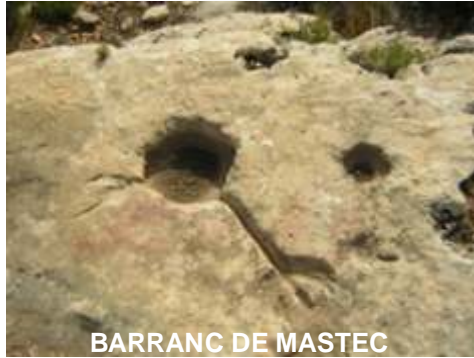
BARRANC DE MASTEC

Los petroglifos son piedras o rocas sobre las que se han tallado motivos simbólicos. Son característicos de las culturas antiguas y, en general, parece que desempeñaban un cometido conmemorativo, indicativo y, en ocasiones, ritual. Su difusión por todo el mundo es enorme, y abarca desde la prehistoria hasta hace tan solo unos siglos. En la cuenca del Mediterráneo tuvieron un gran auge durante el neolítico, con temas muy variados que oscilaban entre los esquemas geométricos (círculos, espirales) y los figurativos (animales, figuras humanas).