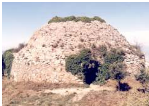
Cava del Benicadell, Gayanes

Altitud: 1.240 m. / Capacidad: 320 m3. Diámetro: 7 m. / Altura: 8,50 m.