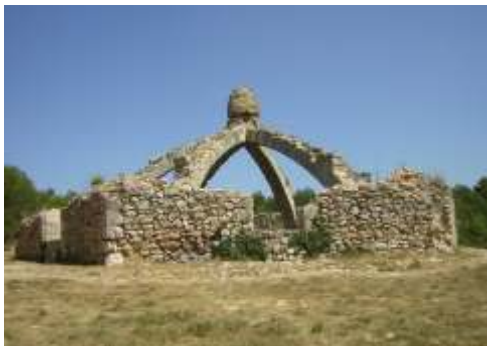
Cava Arqueada, Agres

Desde tiempos antiguos, la nieve y el hielo naturales han tenido diferentes aplicaciones, tanto relacionadas con el transporte de pescado y la conservación de alimentos, así como en la terapéuticas (bajar la fiebre e inflamaciones) y gastronómicas ( helar el agua, el vino y algunas bebidas; elaborando helados y sorbetes). Nuestras montañas han sido las neveras de numerosas poblaciones, hasta que el desarrollo y generalización de la actual industria frigorífica competió con esta actividad tradicional, y la iso desaparecer al principio de los años veinte. Pero aun hoy, podemos apreciar en las montañas, estas maravillosas construcciones, como recuerdo de una época no muy lejana.