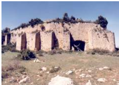
Cava de Don Miguel, Bocai-Alfafa

Altitud: 1.220 m. / Capacidad: 1.960 m3. Diámetro: 14,90 m. / Altura: 12 m.