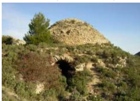
Pou del Rontonar, Torremanzanas

Altitud: 1.350 m. / Capacidad: 1.270 m3. Diámetro: 11,50 m. / Altura: 13 m.