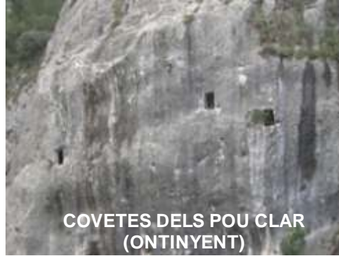
COVETES DELS POU CLAR (ONTINYENT)