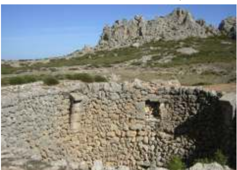
Nevera Pla de la Casa, Fageca

Altitud: 1.230 m. / Capacidad: 2.700 m3. Diámetro: 14,70 m. / Altura: 16,20 m.