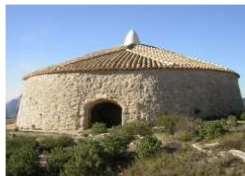
Pou del Surdo, Xixona

Altitud: 1.200 m. / Capacidad: 1.030 m3. Diámetro: 9,80 m. / Altura: 13,75 m.